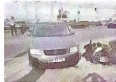
L'urto tra auto e scooter

FANO Un incidente, per fortuna meno grave di quanto appariva in un primo momento si è verificato, ieri, intorno alle 18 sulla statale Adriatica tra Fano e Fossore, all'altezza del Centro Radiomagnetico; ne ha risentito comunque la circolazione, in quel momento particolarmente intensa, che ha subito lunghi